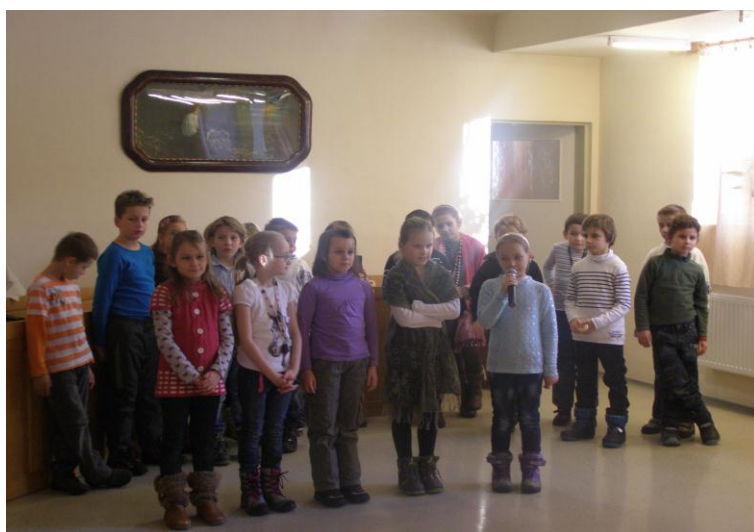
ŠKD – Palúčanská Liptovský Mikuláš